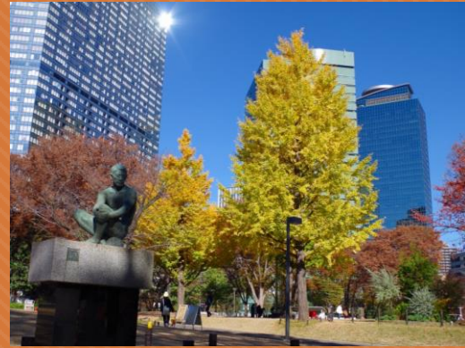
⑥イチョウ(芝生広場)