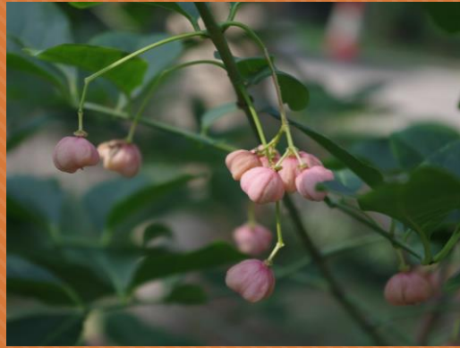
⑤マコミ(眺望のもり)