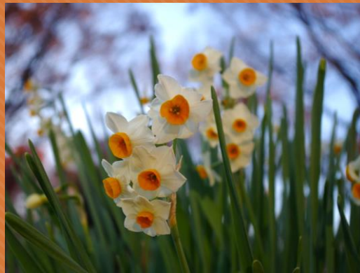
②スイセン(区民の森)