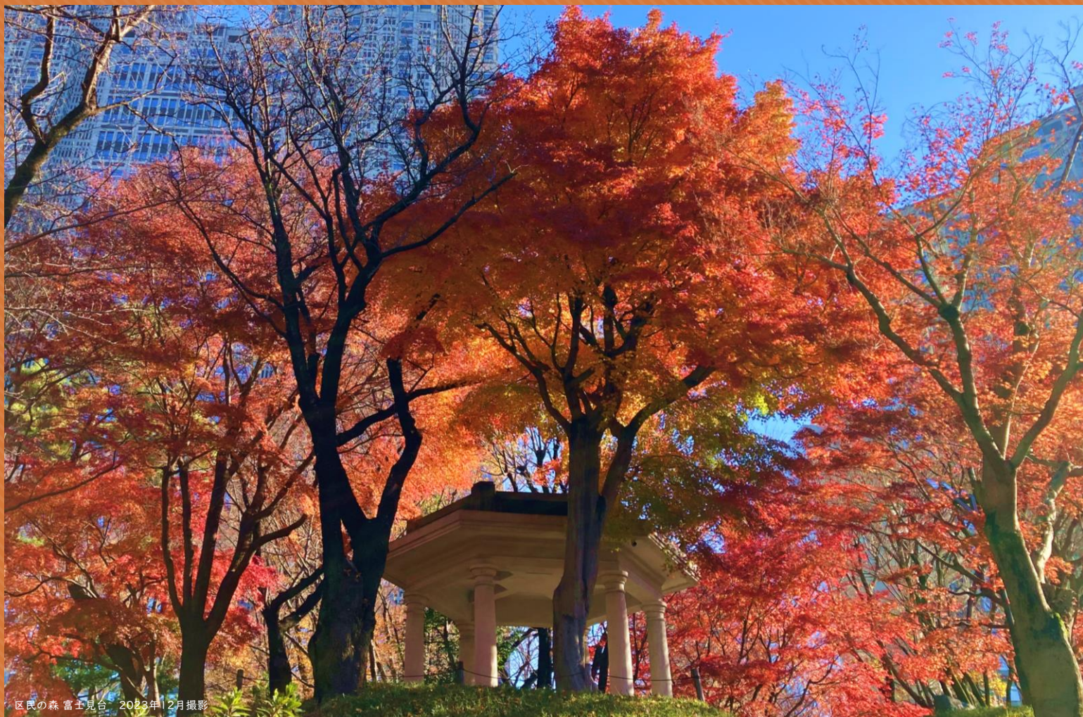
区民の森 富士見台 2023年12月撮影

秋から冬へ、新宿中央公園では美しい紅葉が始まります お散歩が楽しいこの季節は、公園でのんびり過ごしてみたいはいかがでしょうか