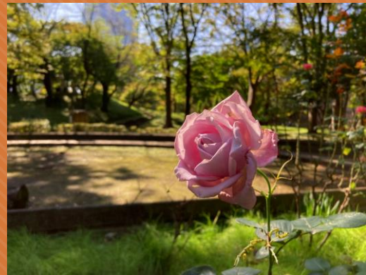
③バラ(ファンモアタイムひろば・区民の森)