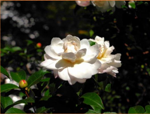
④サザンカ(区民の森)