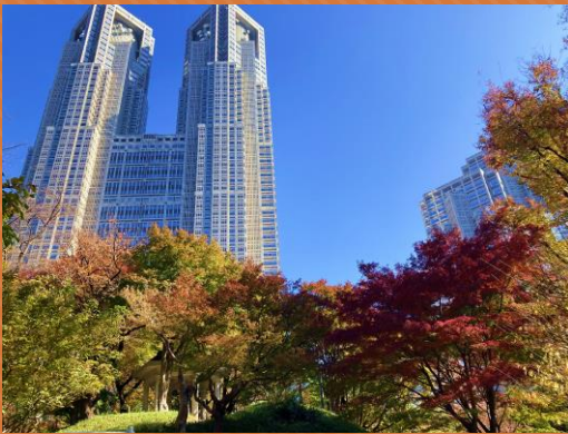
①紅葉(区民の森 富士見台)

秋から冬にかけては公園散策のベストシーズンです。季節が移ろい表情を変える公園の風景、園路の落ち葉やドングリ、美しく色づく紅葉、冬の澄んだ空気はお散歩をより充実した物にしてくれます。こちらで紹介しているものはほんの一例ですので、公園を散策して自分だけのお気に入りの紅葉スポットや植物を見つけましょう。お散歩がきっともっと楽しくなるはず♪