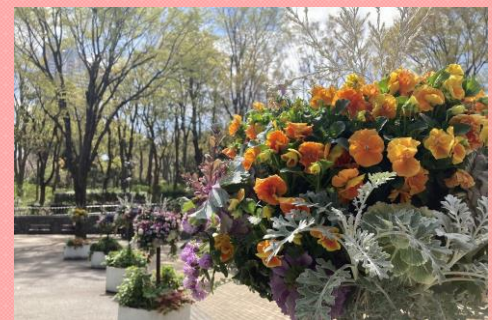
園内 ハングングバスケット