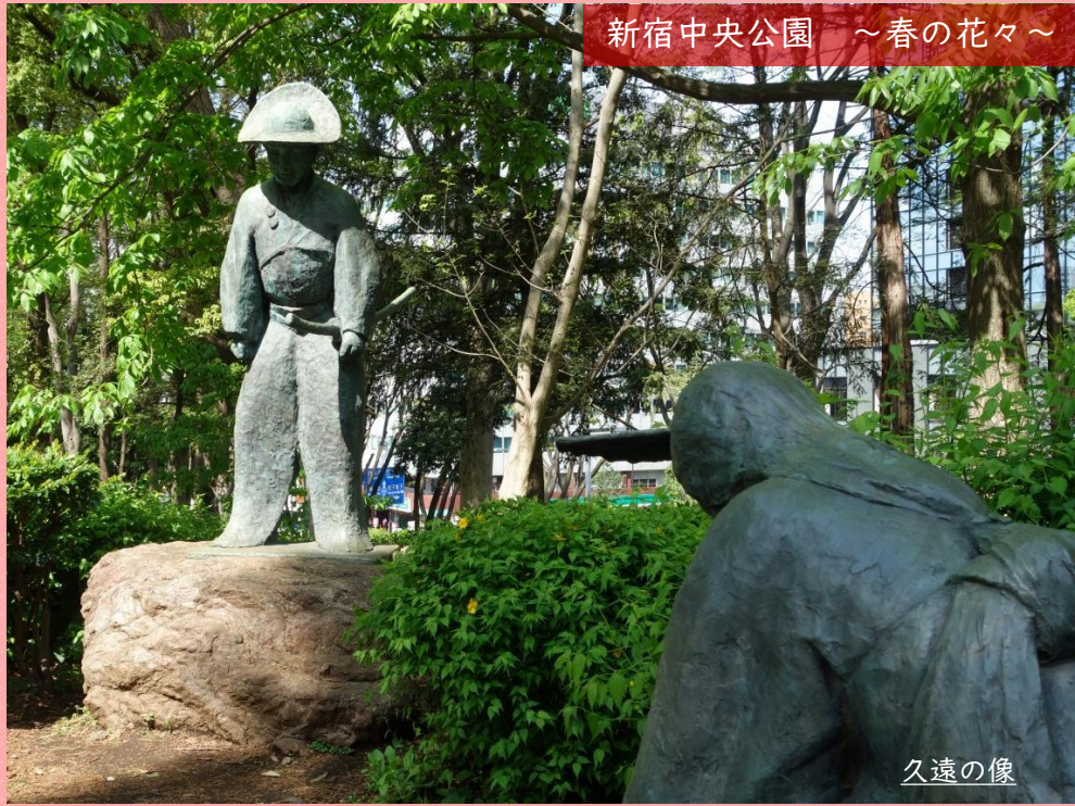
新宿中央公園 ～春の花々～