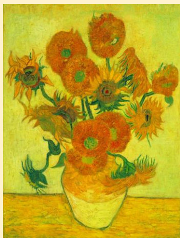
フィンセント・ファン・ゴッホ《ひまわり》1888年