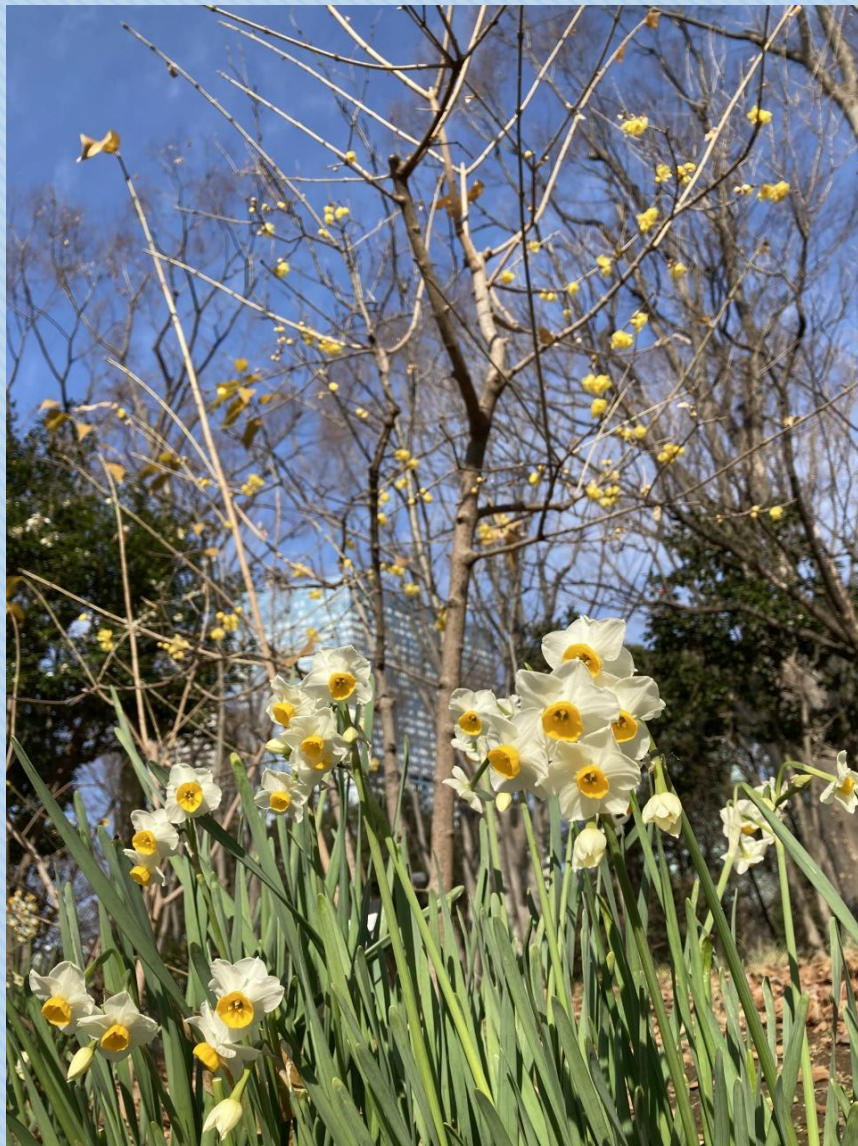
スイセンとロウバイ 撮影場所：区民の森

まだまだ寒い日が続く1月～2月ですが、公園内の植物たちは早い春を教えてくれます。植物を観察しながらのんびりとお散歩すると、いろいろな発見があるかもしれません。