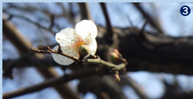
銀世界 開花時期：1月～3月

冬の公園を優しく彩る、白い梅のなる梅林は「銀世界」と呼ばれています。東京都庁を背景に新宿中央公園ならではの写真撮影を楽しむこともできます。