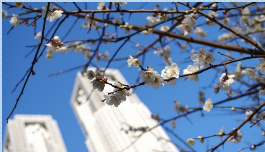
銀世界と東京都庁 撮影場所：区民の森 管理事務所前

白と黄色のコントラストが魅力のスイセンと、ポップコーンのようにポツポツとなる可愛い見た目のロウバイ。耐寒性が強く、寒い冬の時期でも元気に咲き誇り、いち早く春の訪れを知らせてくれます。