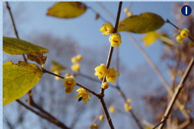
ロウバイ 開花時期：12月～2月